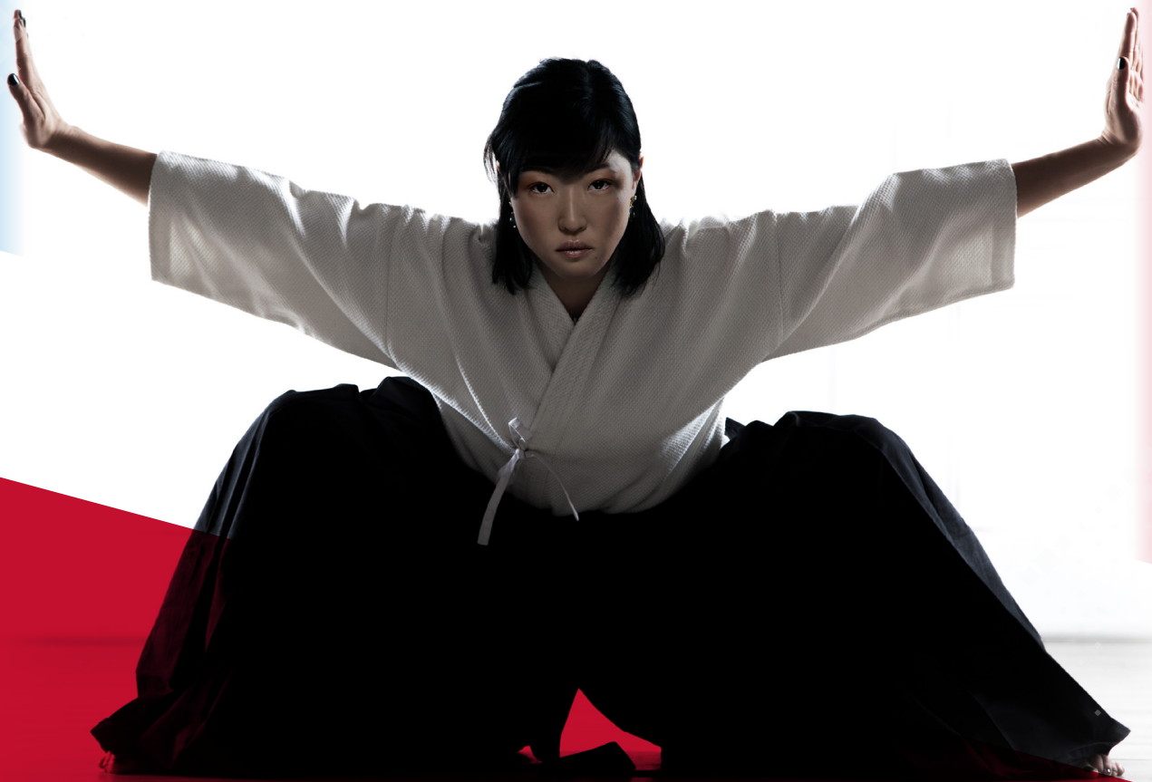
Tabela de Preços Maio 2024